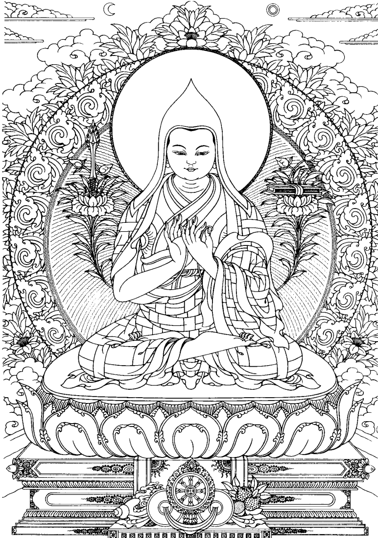
Lama Tông Khách Ba [Lama Tsong Khapa]